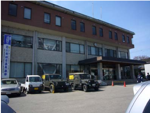
輪島市門前総合支所（災害対策本部門前現地）