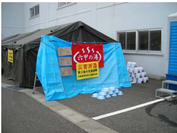
自衛隊による入浴サービス （柏崎小学校裏）