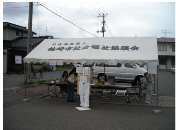
柏崎市災害ボランティアセンターの受付