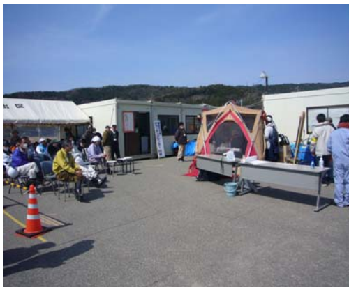
輪島市災害ボランティアセンター門前