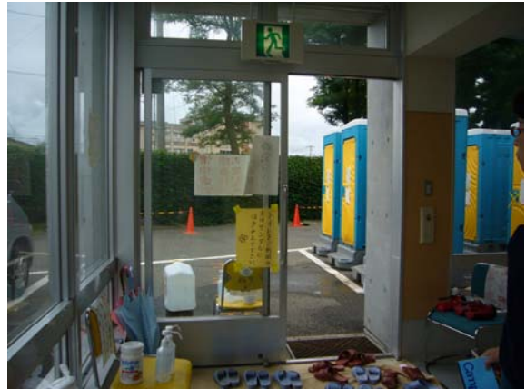
仮設トイレと消毒資材（柏崎市元気館）