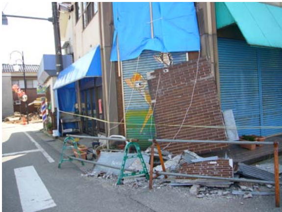
穴水町市街地の倒壊しかけている家屋