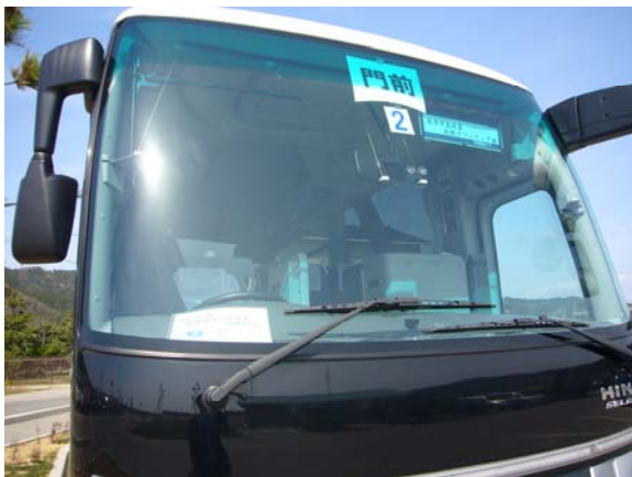
ボランティアバス