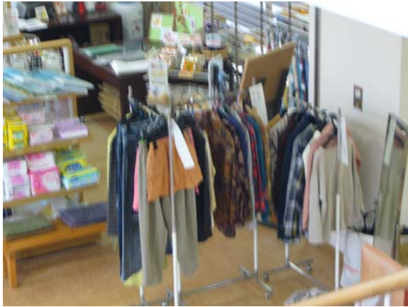
輪島市ふれあい健康センター内

(避難所にもなっていた、支援物資の古着が「ご自由にお持ち下さい」と掛けられている)