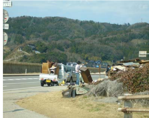
廃棄作業をするボランティア （輪島市門前町道下地区）