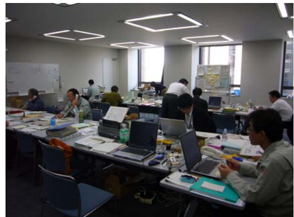
石川県災害対策ボランティア本部 (石川県庁内)