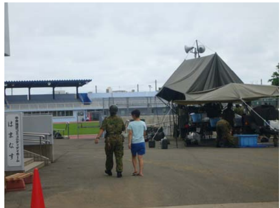
自衛隊と地域のボランティアとの協働 （柏崎小学校）