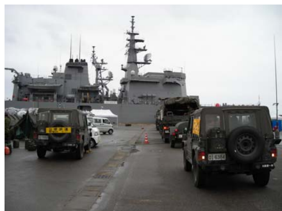
給水のための自衛隊艦船（柏崎港）