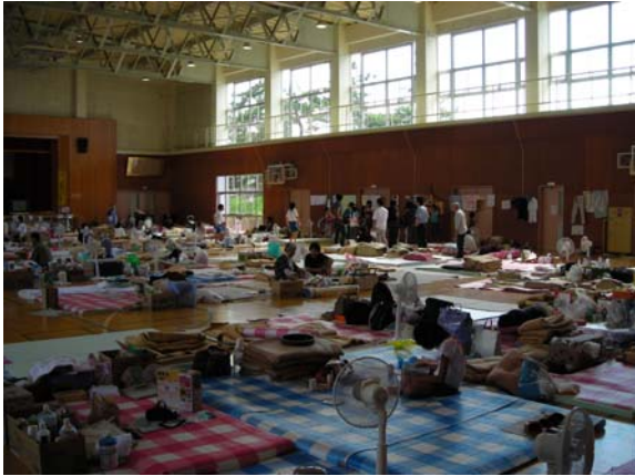
柏崎小学校（避難所）