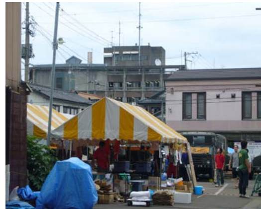
えんま通り商店街での在宅被災者向けの 炊き出し (遠景は柏崎市役所)