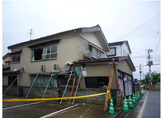
倒壊しかけている家屋 （柏崎市中心部）