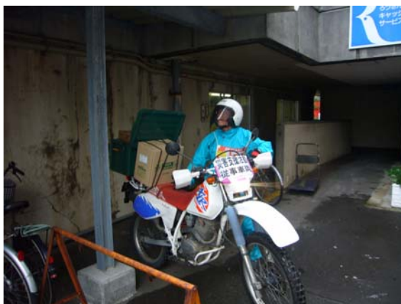
レスキューバイク隊のボランティア （柏崎市役所から被災者に物資配達に出発）