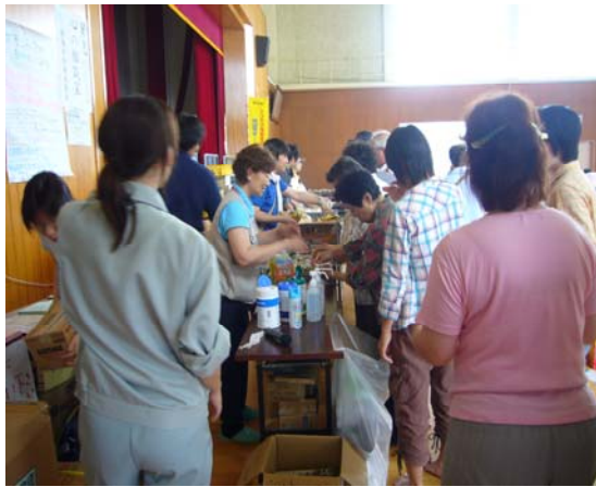
避難所での食事の配給 (柏崎小学校、派遣保健師等が活躍)