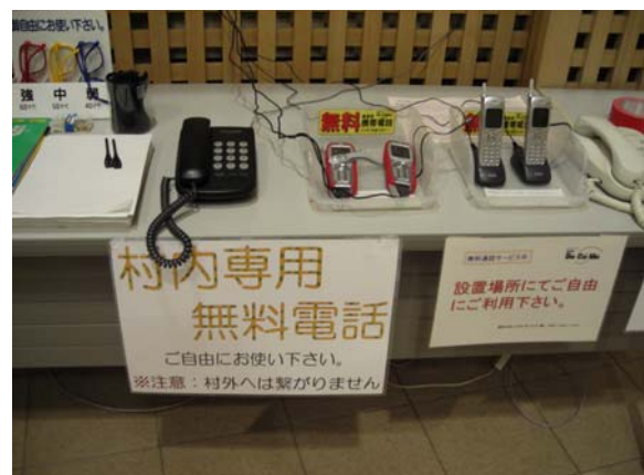
避難所内の無料電話 (刈羽村生涯学習センターラピカ)