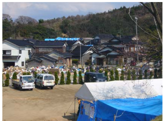
ボランティアによる片付け作業 (輪島市門前町諸岡公民館前)