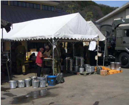
自衛隊による炊き出し (住民も協働している模様)