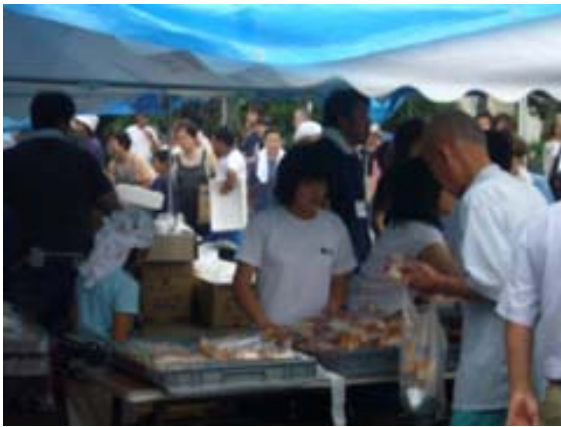
地域の中学生ボランティアによる 物資配布（柏崎小学校）