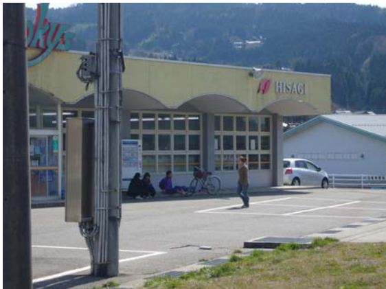
平常通り営業する書店とその前でたむろする中学生 (輪島市門前町中心部)