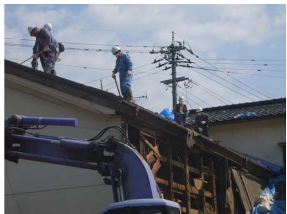
業者による被災家屋の解体作業 （粉塵を舞い上げながらの作業）