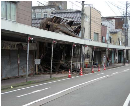
被害の激しかった、えんま通り商店街