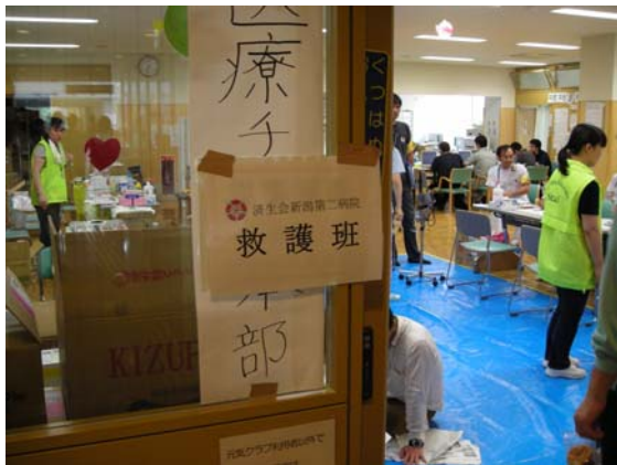
医療チーム本部 (柏崎市元気館) (柏崎保健所長がコーディネータ)