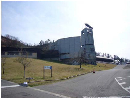
ビュー・サンセット (公共宿泊施設、避難所として活用)