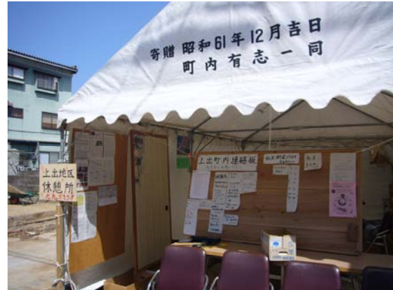
穴水町上出地区休憩所（町内会が開設）

(避難所にもなっていた、支援物資の古着が「ご自由にお持ち下さい」と掛けられている)