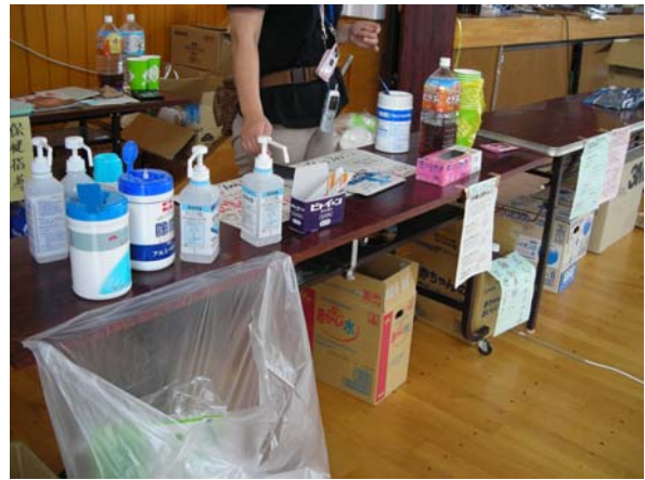
食事提供時用の消毒資材 (柏崎小学校)