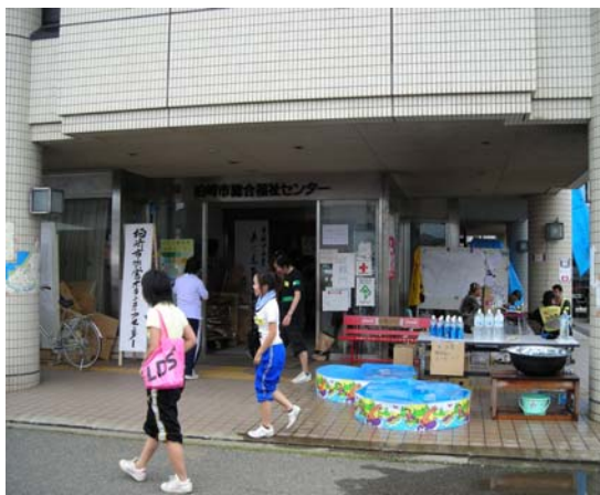
柏崎市災害ボランティアセンター （柏崎市総合福祉センター）