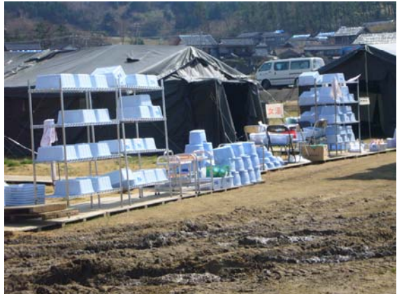
自衛隊による入浴サービス