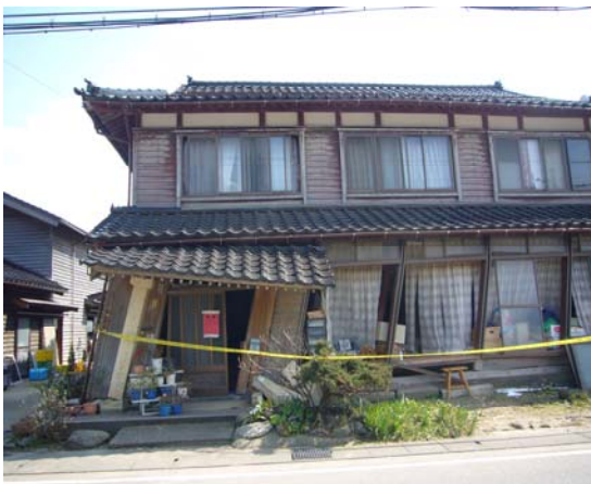
倒壊しかけている家屋 （輪島市門前町道下地区）