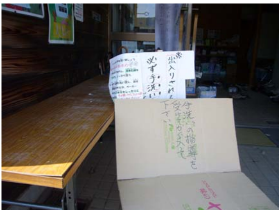
避難所入口の手洗いを呼びかける表示 (輪島市門前町諸岡公民館)