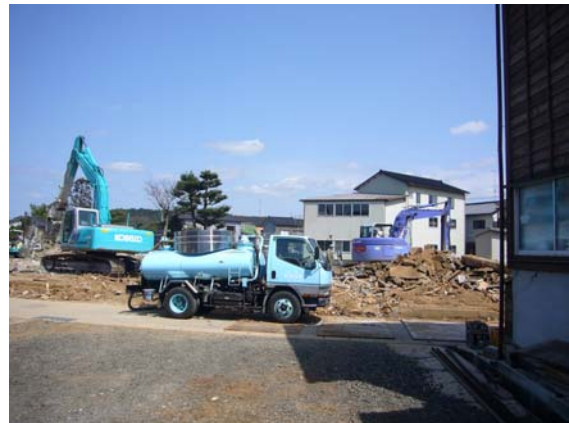
解体を終了した家屋（バキュームカーが便所の汚物処理をしている）