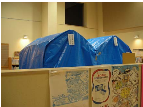
避難所内の着替え等のスペース (刈羽村生涯学習センターラピカ)